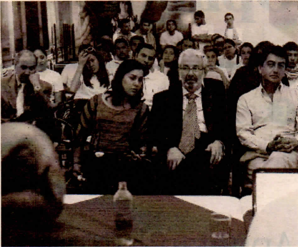
AYER SE REALIZÓ UNA CHARLA INFORMATIVA.